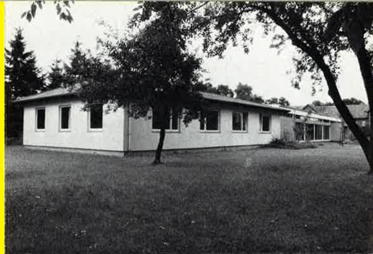
Haus für Beschäftigungstherapie

Der Ort Liebenburg mit seinen 3000 Einwohnern liegt etwas nördlich von Goslar in waldreicher hügeliger Umgebung des Harzvorlandes. Die schöne Umgebung unseres Ortes bietet den Patienten Gelegenheit zu kleineren und ausgedehnten Spaziergängen. Der Bau eines Freizeitgeländes mit modernem Schwimmbad ist im Entstehen.