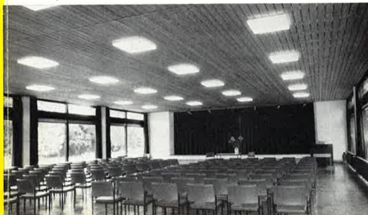
Hauptraum des Gemeinschaftshauses

Es ist für alle Patienten, die einer Krankenkasse oder einer Privatversicherung angehören, zweckmäßig, daß sich der einweisende Arzt vor der Aufnahme mit der Kasse bzw. Versicherung in Verbindung setzt.